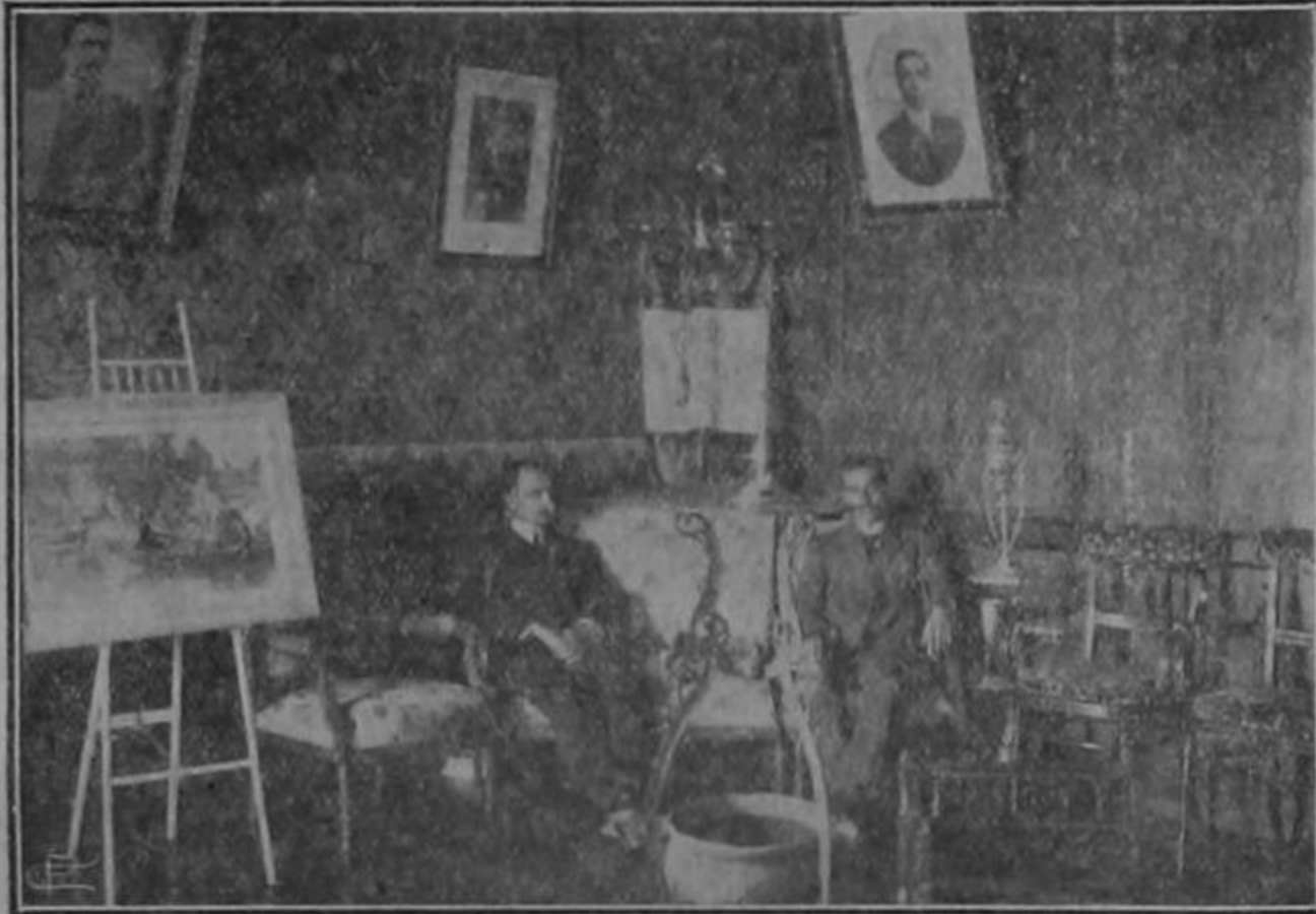
Una fiesta en el «Alfonso XIII»

Con un baile celebrará hoy a las 9 de la noche el 7º Aniversario de su fundación el Club Sport «Alfonso XIII», que tantas simpatías se ha captado por sus desinteresadas iniciativas a la hora en que el país ha necesitado del auxilio de las asociaciones.